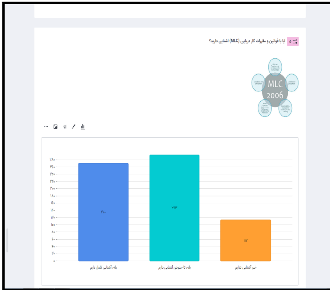
نمودار آماری آشنایی با قوانین کار دریانوردی MLC

این سامانه تا پایان اردیبهشت فعال می باشد